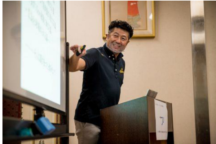
シクロクロス研修会 座学 アンチドーピング講習