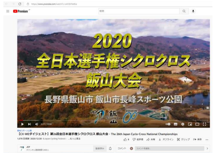
女子エリートダイジェスト版