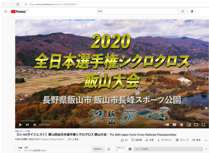
男子エリートダイジェスト版